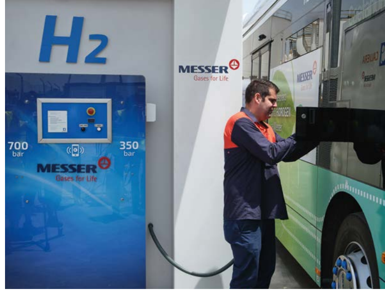
Bei der Versorgung von Bus-Flotten mit Wasserstoff verfügt Messer über langjährige Erfahrung.

Für eine nachhaltige Mobilität arbeitet Messer mit der Toyota Gruppe zusammen und bietet eine umfassende Lösung für wasserstoffbetriebene Busse an – inklusive Hydrogeneratoren und allen für den Betrieb erforderlichen Dienstleistungen: der „One-Stop-Shop“. Im Rahmen des „One-Stop-Shop“ erhalten Sie Fahrzeuge, Finanzierung, Wasserstoff und technischen Service aus einer Hand. Die Bezahlung erfolgt pro gefahrenem Kilometer oder pro Kilogramm verbrauch-