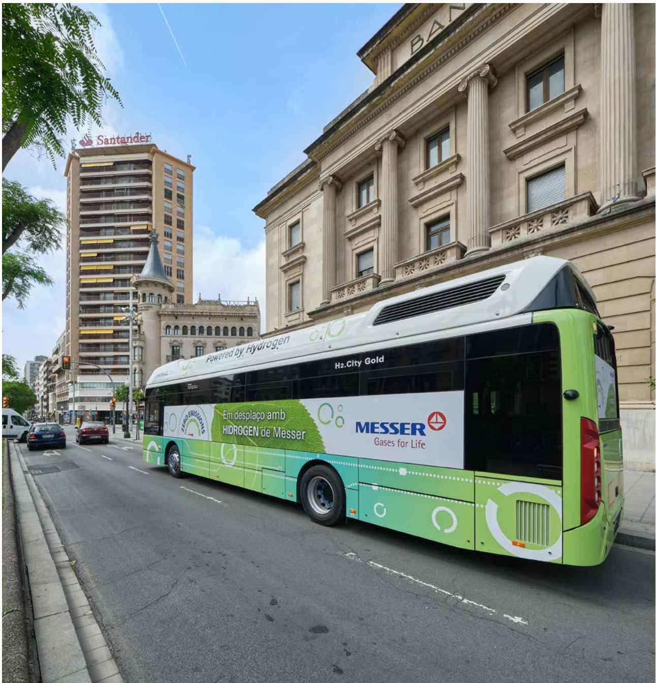
Testfahrt eines brennstoffzellenbetriebenen Busses in Tarragona, Spanien.

Der größte Vorteil von brennstoffzellenbetriebenen, elektrischen Bussen (FCEB) ist sicherlich, dass sie im Gegensatz zu konventionellen, mit Dieselmotoren bestückten Bussen, keine klimaschädlichen Emissionen ausstoßen. Das ist gut für die Umwelt, gut für die Menschen in den Innenstädten und bald vielleicht schon ein „Muss“, da immer mehr Städte beschließen, komplett emissionsfrei zu werden.